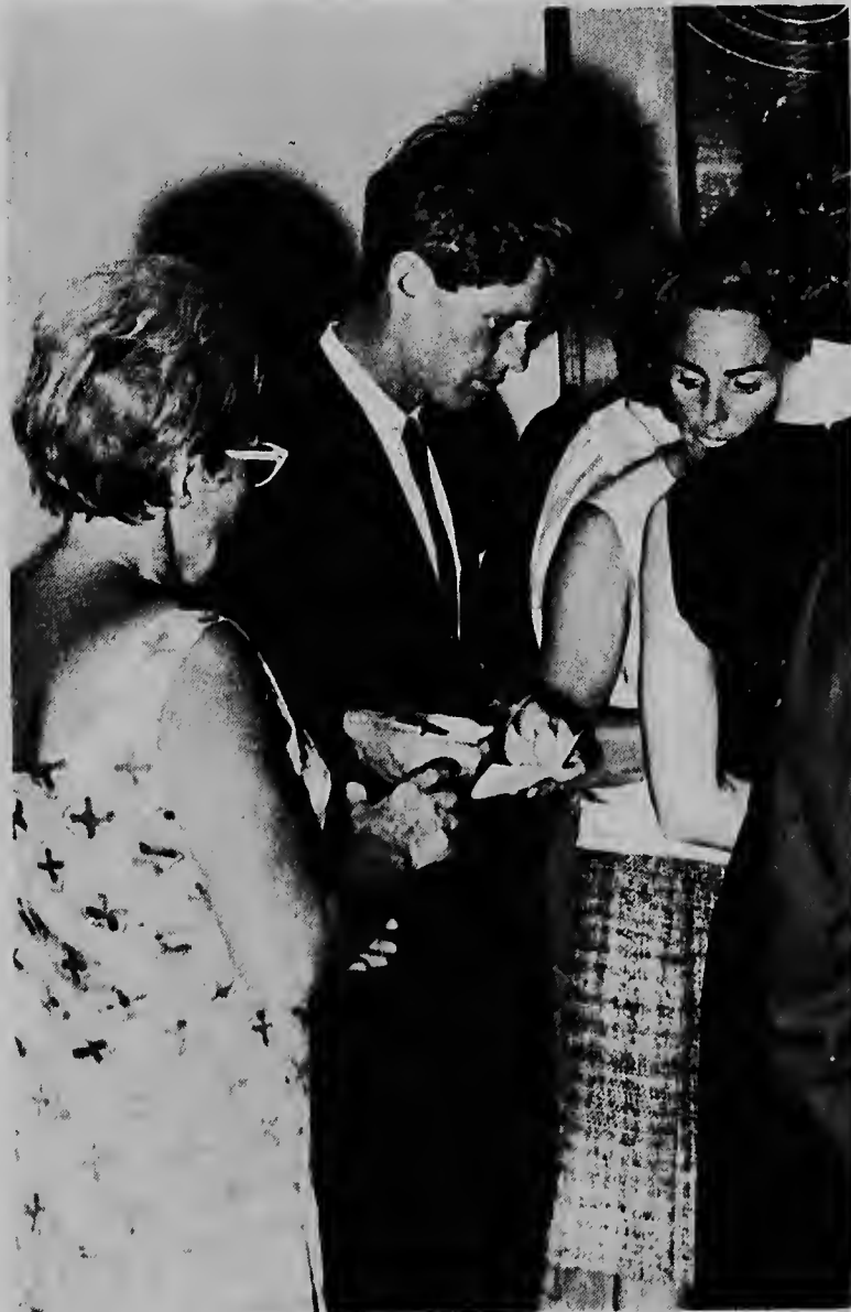
Durante e ratu di ora qu senador Kennedy a permanece den stationsgebouw na Hato, diferente turista a pidiele su autografia, manera nos por mira riba e foto aki. Na su man drechi por mira su señora, Ethel.